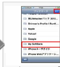
ブックマークから「My SoftBank」をタップします