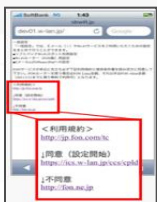
「同意 (設定開始)」をタップ