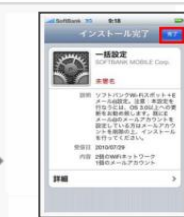
「完了」をタップしますこれで「一括設定」は完了です。