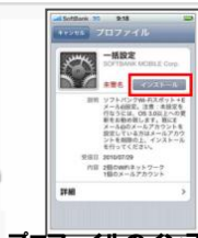
プロフィールのインストール画面が開きます。「インストール」をタップします