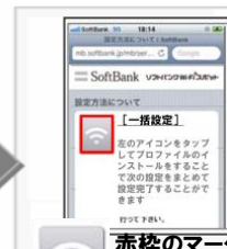
赤枠のマークをタップ