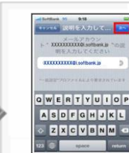
メールアドレスの名称設定が表示されます。「次へ」をタップします