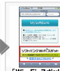
「Wi-Fi スポット」のバナーをタップします