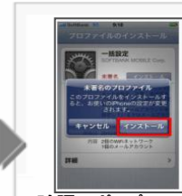
確認のポップアップが現れます。「インストール」をタップします