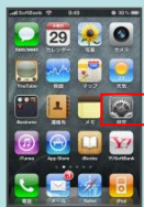
ホーム画面の「設定」